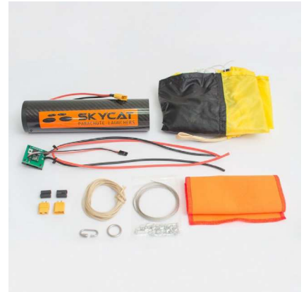
※ 実際の製品の色と一部異なります。